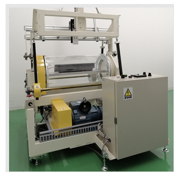
回転ドラム式検査装置