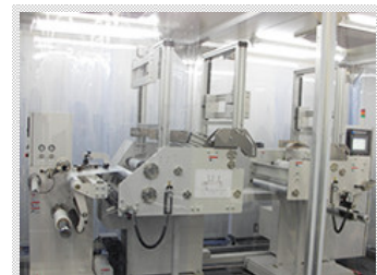
ロール巻替検査装置