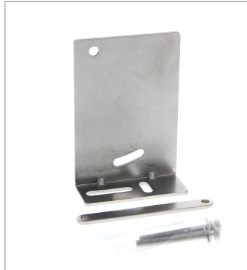
Mounting Bracket E39-L181