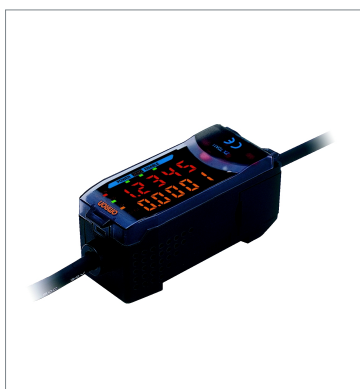
スマートセンサ 高精度接触タイプ ZX-TDA41 2M