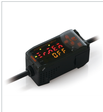
Smart Sensors (Laser Type) ZX-LDA11-N 2M