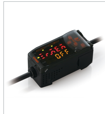
Smart Sensors (Laser Type) ZX-LDA41-N 2M