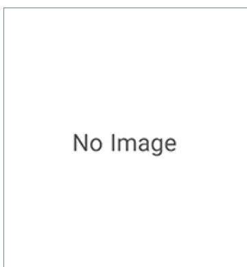
Cables with Connectors on Both Ends ZX-XC8A 8M