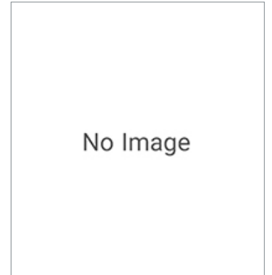
Cables with Connectors on Both Ends ZX-XC4A 4M