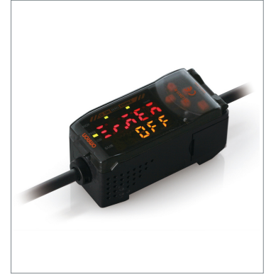
Smart Sensors (Laser Type) ZX-LDA41-N 2M