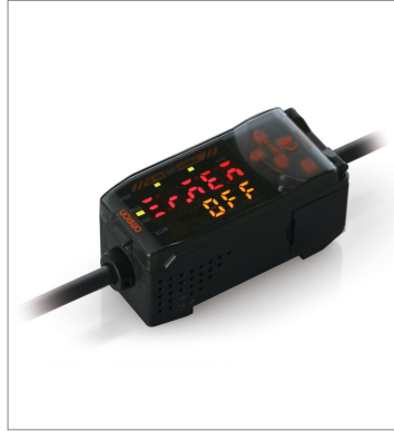
Smart Sensors (Laser Type) ZX-LDA11-N 2M