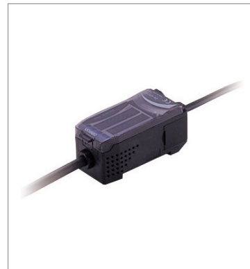
スマートセンサ レーザ式測長センサ ライン撮像素子タイプ ZX-GTC11