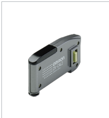
Calculating Unit ZX-CAL2