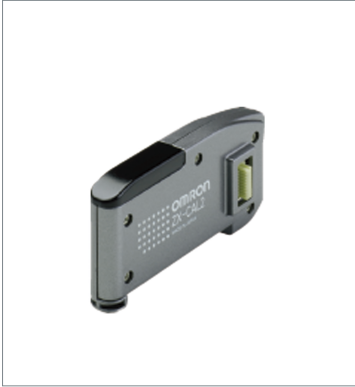
Calculating Unit ZX-CAL2