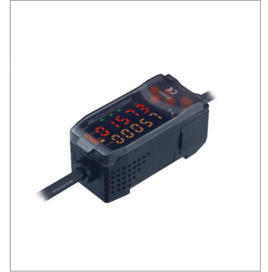
Smart Sensors (Inductive Displacement Type) ZX-EDA41 2M