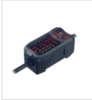
Smart Sensors (Inductive Displacement Type) ZX-EDA11 2M