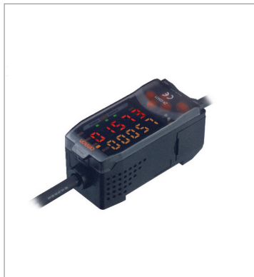
Smart Sensors (Inductive Displacement Type) ZX-EDA11 2M