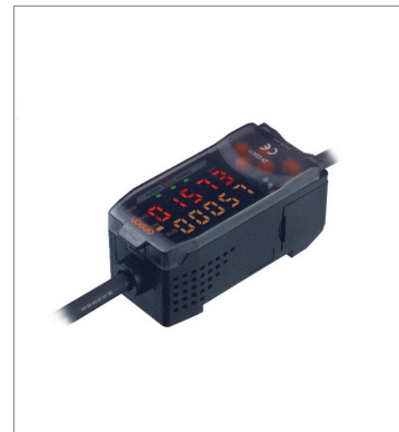
Smart Sensors (Inductive Displacement Type) ZX-EDA41 2M