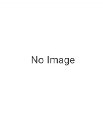
RS-232C Cable ZS-XRS3