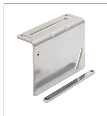
レーザ変位センサ ZP-XL4