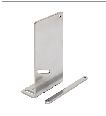
Laser displacement sensor