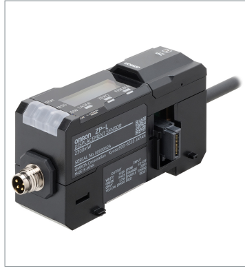
Laser displacement sensor