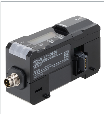
Laser displacement sensor