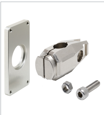
Laser displacement sensor