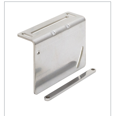
Laser displacement sensor