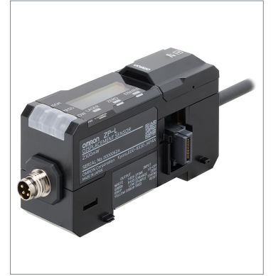
Laser displacement sensor