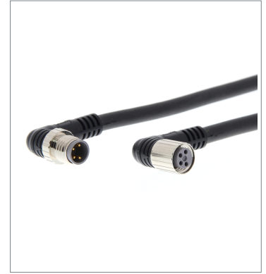
Round Water-resistant Connector XS3W-M422-420-PR