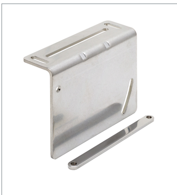
レーザ変位センサ