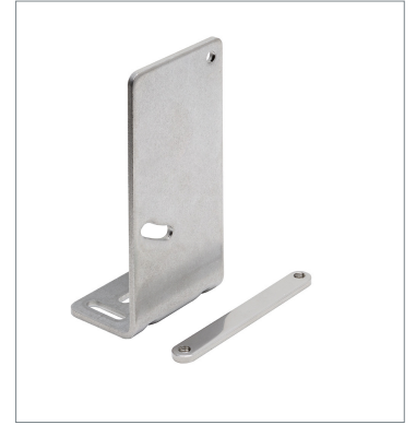
Laser displacement sensor ZP-XL1