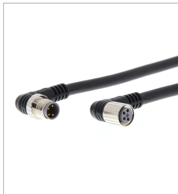
Round Water-resistant Connector