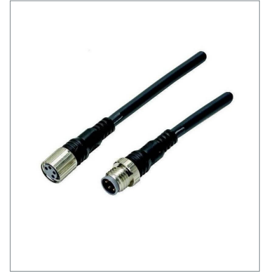
Round Water-resistant Connector