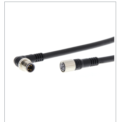
Round Water-resistant Connector XS3W-M423-401-R