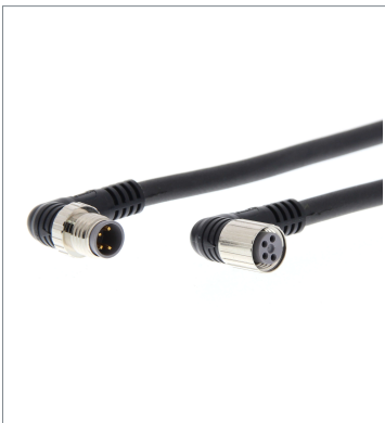
Round Water-resistant Connector