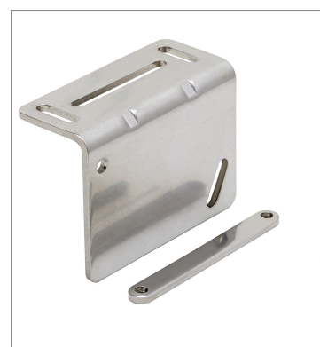
背面取り付け金具 ZP-XL2