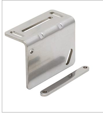
Laser displacement sensor ZP-XL2