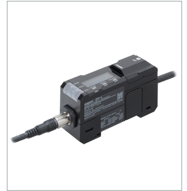
Laser displacement sensor ZP-L3000