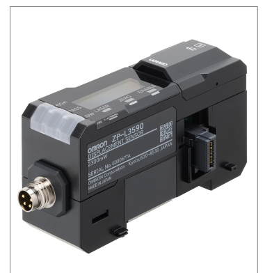
Laser displacement sensor ZP-L3590