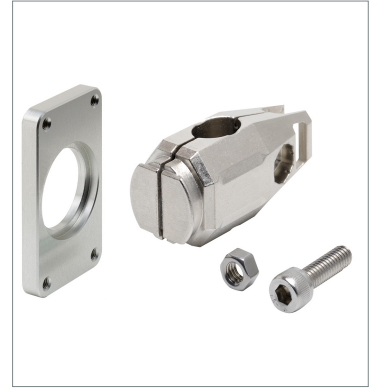
Laser displacement sensor ZP-XL5