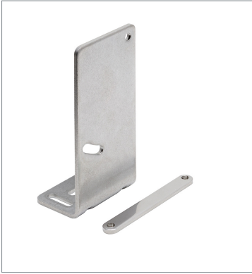
Laser displacement sensor ZP-XL1