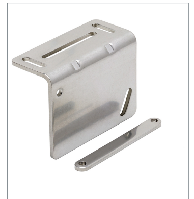
Laser displacement sensor ZP-XL2