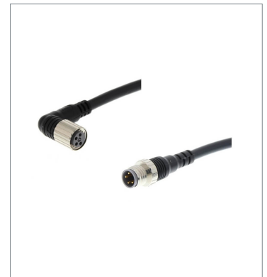
Round Water-resistant Connector XS3W-M424-420-R