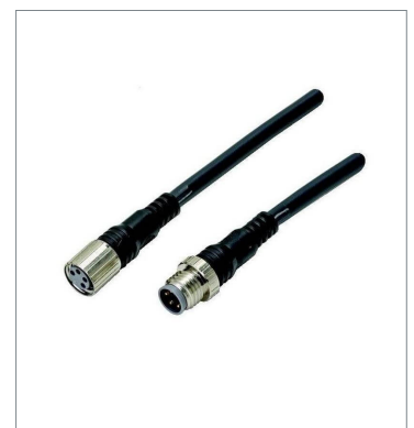
Round Water-resistant Connector XS3W-M421-410-PR