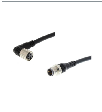
Round Water-resistant Connector XS3W-M424-420-PR