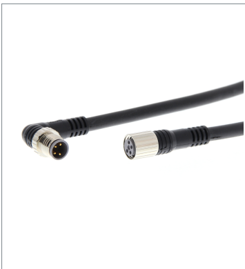
Round Water-resistant Connector XS3W-M423-420-PR