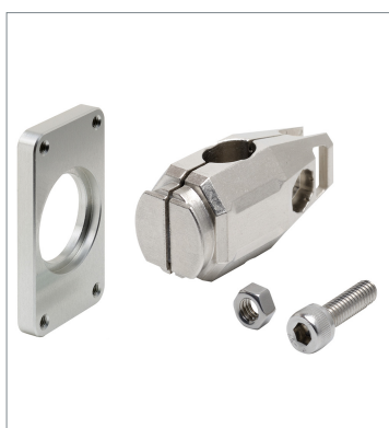
Laser displacement sensor ZP-XL5