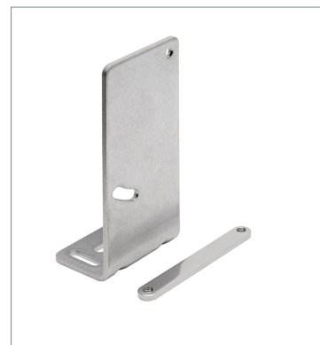
Laser displacement sensor ZP-XL1