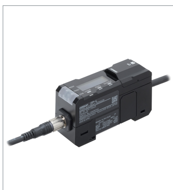
Laser displacement sensor ZP-L3000