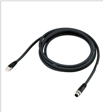
Ethernet Communication Cable V430-WE-5M