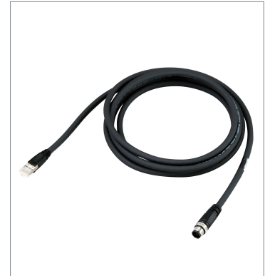
Ethernet Communication Cable V430-WE-3M