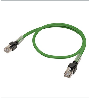
Industrial Ethernet Cables