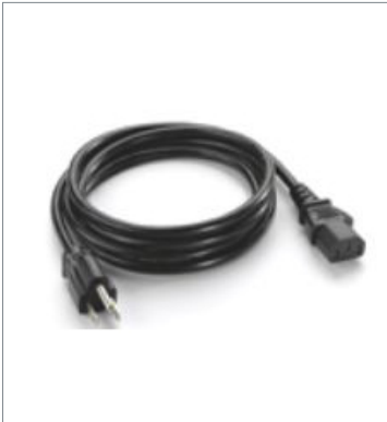
AC Power Cable 12-9001046-01