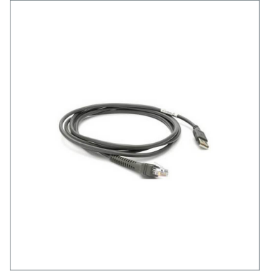
USB Cable V410-WUB-2M