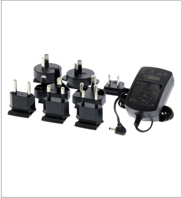
AC Power Supply Kit V410-AC0-1