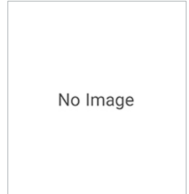
接続ケーブル V509-W016 5M