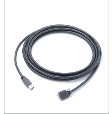
USB3.0 ノーマルケーブル CAB-USB3-05