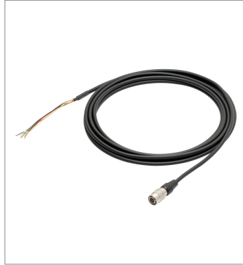
Camera cable FJ-VSP2 5M