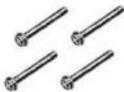
M4 screws x 4