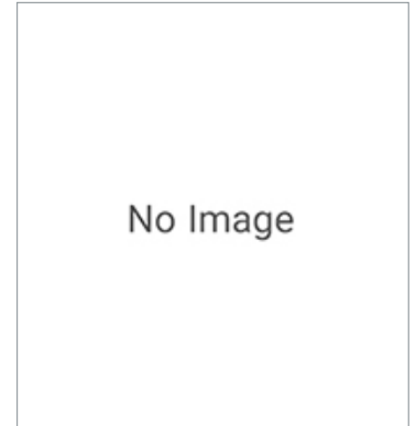
Control I/O Connector (CN1) R88A-CN101C