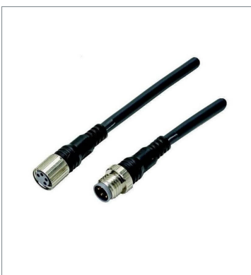
Round Water-resistant Connector