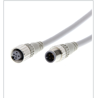
Round Water-resistant Connectors (M12 Threads)