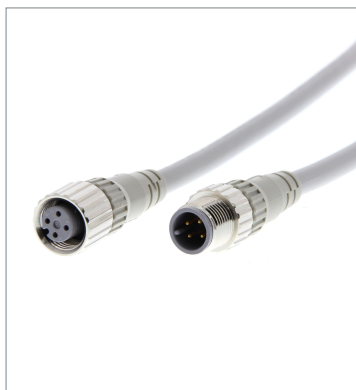
Round Water-resistant Connectors (M12 Threads)