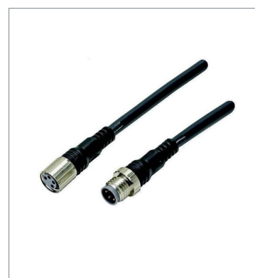
Round Water-resistant Connector