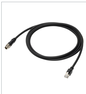
Industrial Ethernet Connectors with Cable