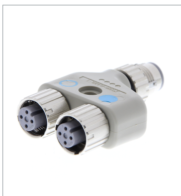
Round Water-resistant Connector (M12 Smartclick)