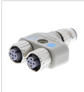
丸型防水コネクタ (M12 スマートクリック) XS5R-D426-1