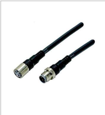
Round Water-resistant Connector