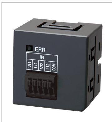
Analog Input Option Board NX1W-ADB21