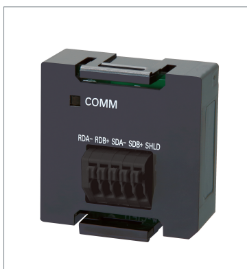
Serial Communications Option Boards NX1W-CIF12