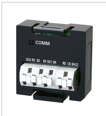
Serial Communications Option Boards NX1W-CIF01