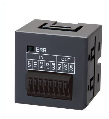
Analog I/O Option Board NX1W-MAB221