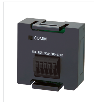
Serial Communications Option Boards NX1W-CIF11