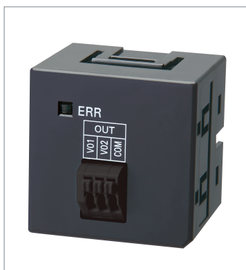
Analog Output Optional Boards NX1W-DAB21V