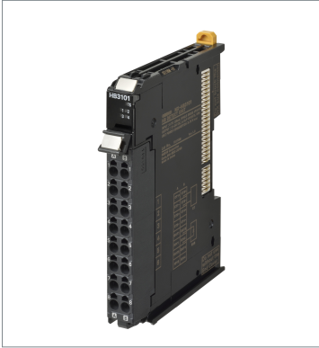
ヒータ断線検知ユニット