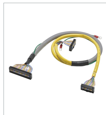
Cables for I/O Relay Terminals (1:2) XW2Z-RO50-25-D1