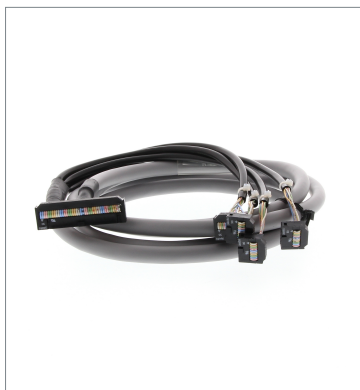
OMRON PLC (MIL connector Type) Connecting Cable with Connectors P2RV-4-200C