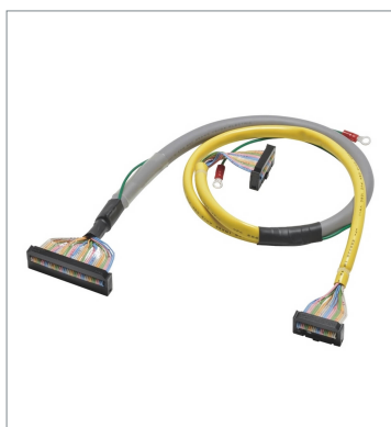
Cables for I/O Relay Terminals (1:2) XW2Z-RO200-175-D1