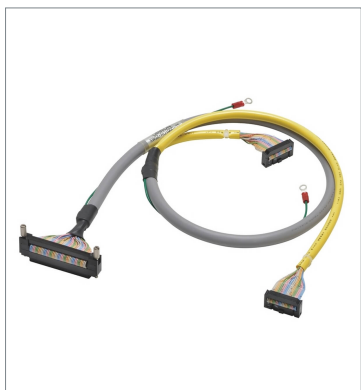
I/Oリレーターミナル用コネクタ付ケーブル (1対2)