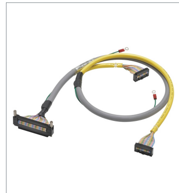
I/Oリレーターミナル用コネクタ付ケーブル (1対2)