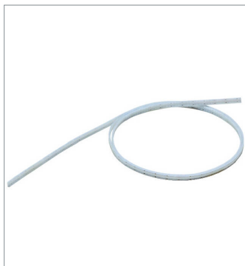
漏液検知帯 F03-16PE 15M