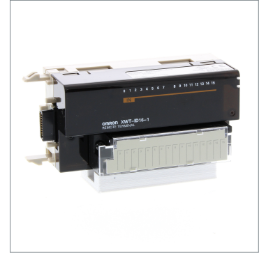
Remote I/O Terminal XWT-ID16-1