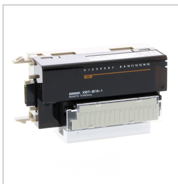
Remote I/O Terminal XWT-ID16-1