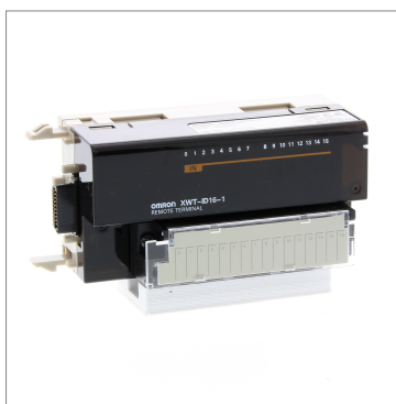
Remote I/O Terminal XWT-ID16