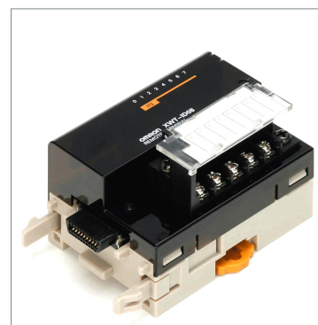
Remote I/O Terminal XWT-OD08