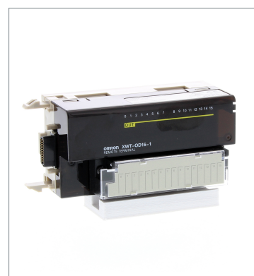
Remote I/O Terminal XWT-OD16-1