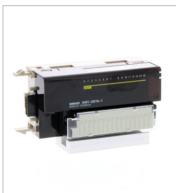
Remote I/O Terminal XWT-OD16