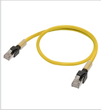
Industrial Ethernet Cables XS6W-6LSZH8SS20CM-Y