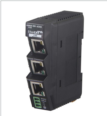
EtherCAT Junction Slave GX-JC03