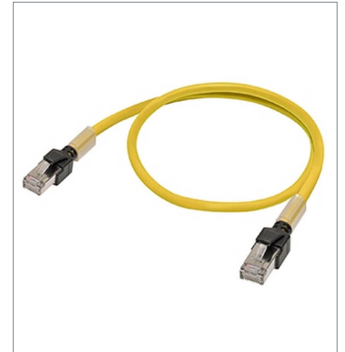
Industrial Ethernet Cables XS6W-6LSZH8SS20CM-Y