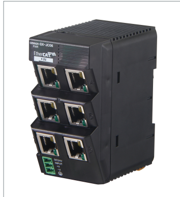
EtherCAT Junction Slave GX-JC06