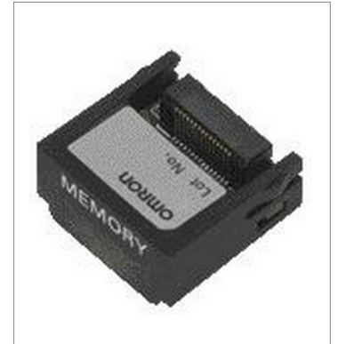
Memory Cassette CP1W-ME05M