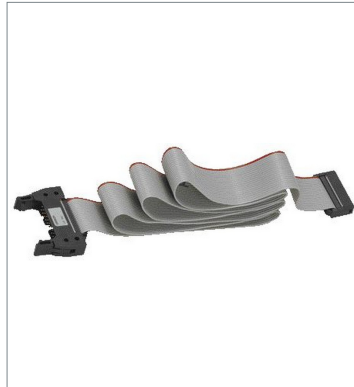
I/O Connecting Cables CP1W-CN811