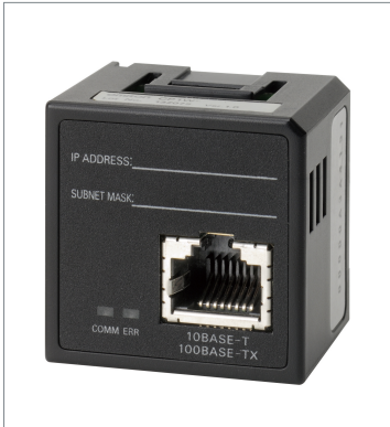
Ethernet オプションボード CP1W-CIF41