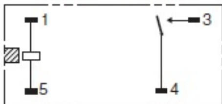
端子配置/内部接続図 (BOTTOM VIEW)