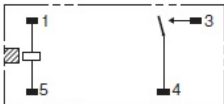
端子配置/内部接続図 (BOTTOM VIEW)