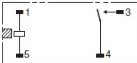
端子配置/内部接続図 (BOTTOM VIEW)