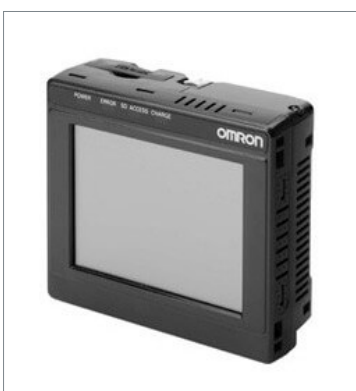
Touch Finder FQ2-D30