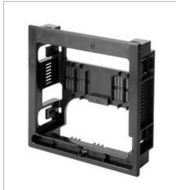
Panel Mount Adapter FQ-XPM