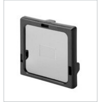
Polarizing Filter Attachment FQ-XF1