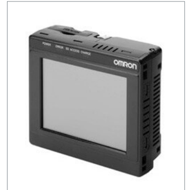
Touch Finder FQ2-D30