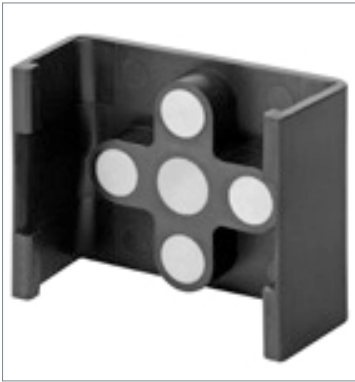
Mounting Bracket FQ-XL