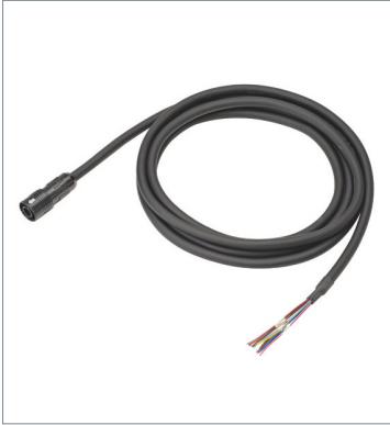
I/O Cable FQ-WD020