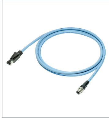
イーサネットケーブル FQ-WN010