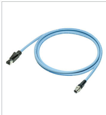
Ethernet Cable FQ-WN010