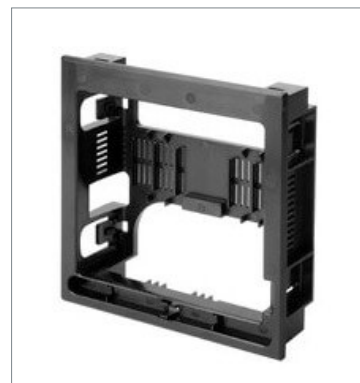
Panel Mount Adapter FQ-XPM